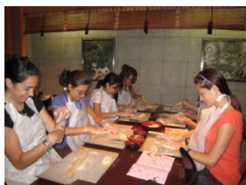
Preparazione di dolci giapponesi