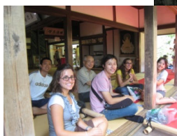
Visite ai templi ed ai santuari