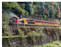
Viaggi in tram e in barca ad