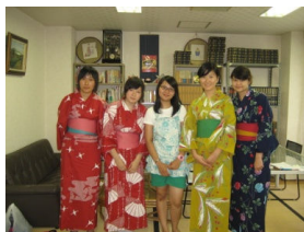
Vestire gli Yukata