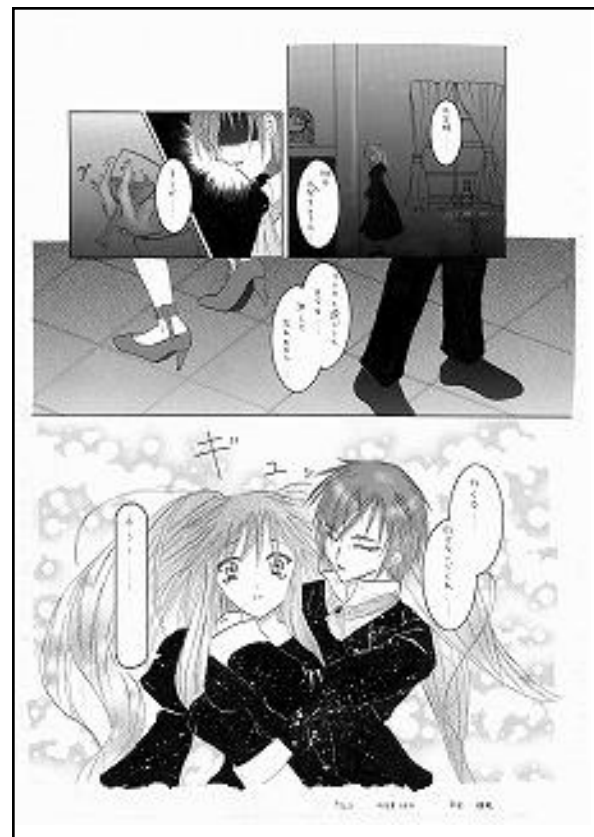
Esempi di lavori finiti